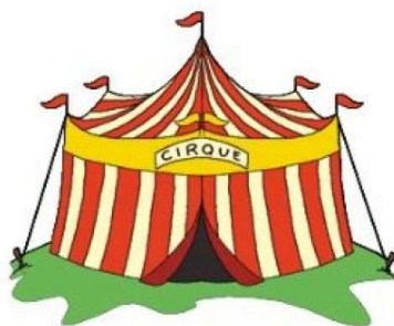
MARIE ET FLORIAN

L'école de Grâce-Uzel accueille un cirque à partir du 21 janvier sur la place de la salle Arc en ciel. Nous nous entraînerons toute la semaine afin de présenter un spectacle le vendredi 25 janvier à 20h30. Tout le monde est invité à venir nous voir. (5€ par adulte et 2€ par enfant)