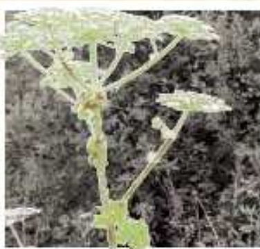
LA BERCE DU CAUCASE