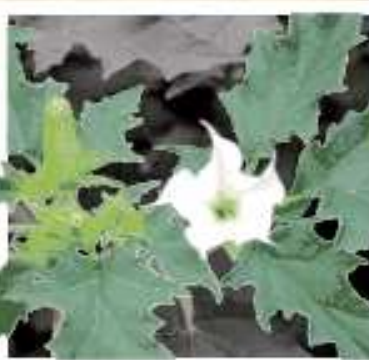
LE DATURA STRAMOINE