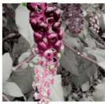
LE RAISIN D'AMÉRIQUE