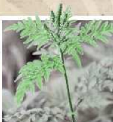
L'AMBROISIE À FEUILLES D'ARMOISE

COMMENT LES RECONNAÎTRE ? QUE FAUT-IL FAIRE ?