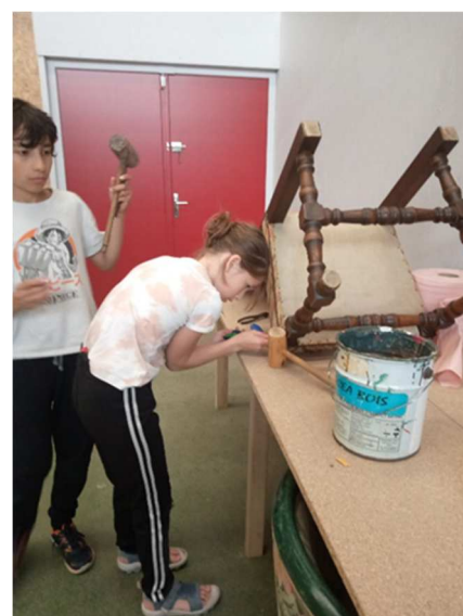
Photo des enfants lors de la porte ouverte présentant leur travail