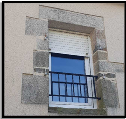
Exemple de la maison de la renaissance, datée 1752 ou 1759.